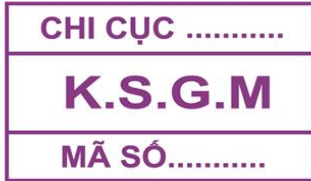
Hình 9: Mẫu dấu kiểm soát giết mổ gia súc