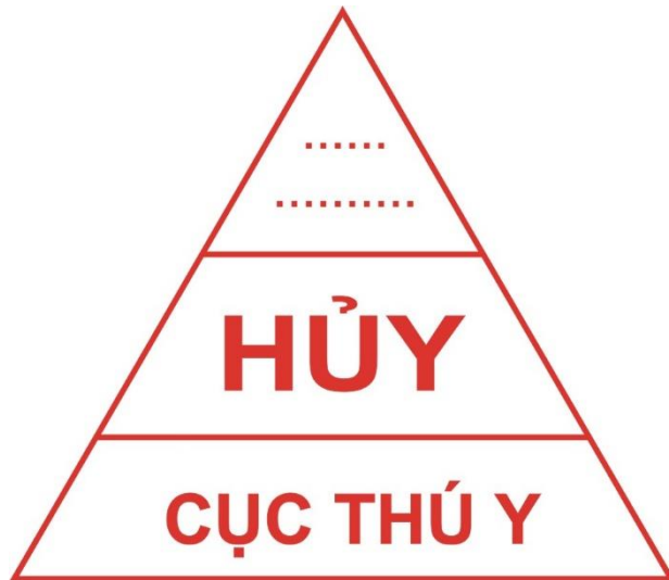
Hình 7: Mẫu dấu hủy đối với gia súc