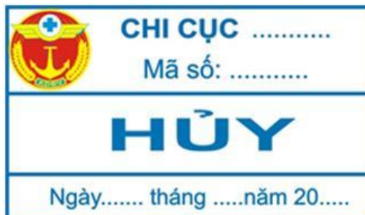
Hình 20: Mẫu tem tiêu hủy