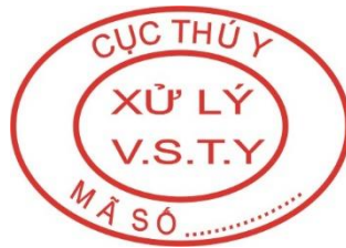
Hình 6. Mẫu dấu xử lý vệ sinh thú y đối với gia cầm