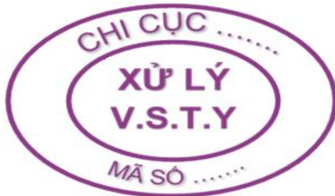
Hình 11: Mẫu dấu xử lý vệ sinh thú y đối với gia súc