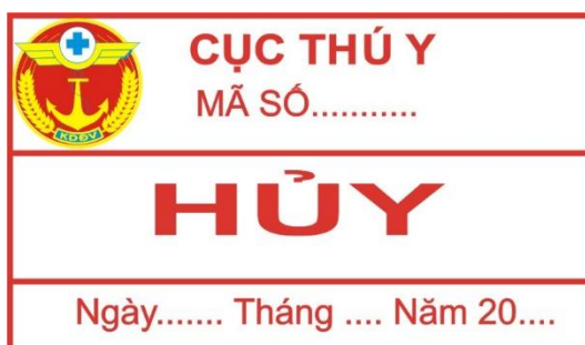
Hình 17: Mẫu tem tiêu hủy