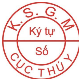
Hình 1. Mẫu dấu kiểm soát giết mổ gia súc để xuất khẩu