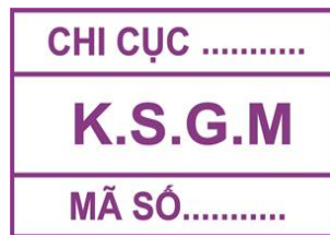
Hình 10: Mẫu dấu kiểm soát giết mổ gia cầm