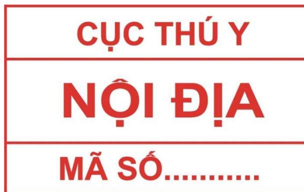
Hình 3. Mẫu dấu kiểm soát giết mổ gia súc để tiêu thụ nội địa