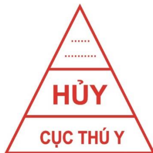
Hình 8. Mẫu dấu hủy đối với gia cầm