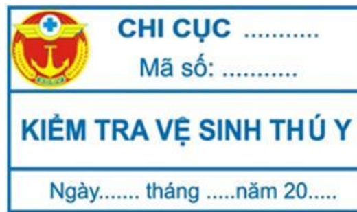
Hình 18: Mẫu tem vệ sinh thú y