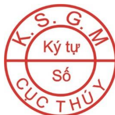
Hình 2. Mẫu dấu kiểm soát giết mổ gia cầm để xuất khẩu