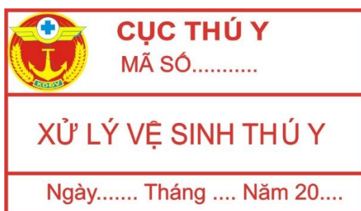
Hình 16: Mẫu tem xử lý vệ sinh thú y