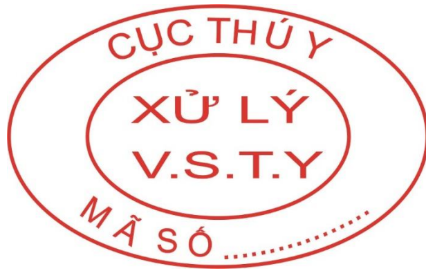
Hình 5: Mẫu dấu xử lý vệ sinh thú y đối với gia súc