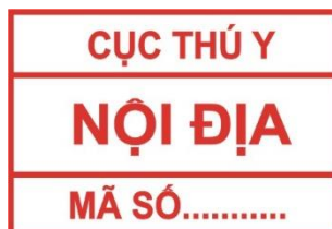
Hình 4. Mẫu dấu kiểm soát giết mổ gia cầm để tiêu thụ nội địa