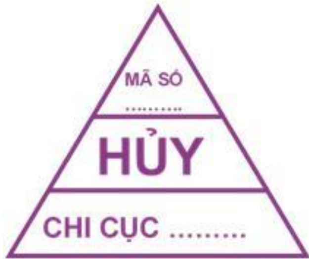
Hình 13: Mẫu dấu hủy đối với gia súc