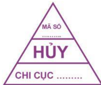
Hình 14: Mẫu dấu hủy đối với gia cầm