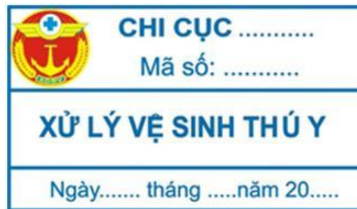
Hình 19: Mẫu tem xử lý vệ sinh thú y