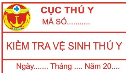
Hình 15: Mẫu tem vệ sinh thú y